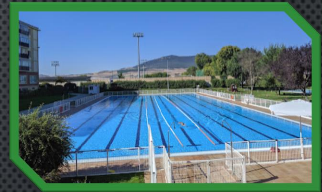
Piscinas de verano