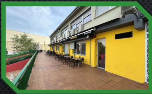
Oscar's My way