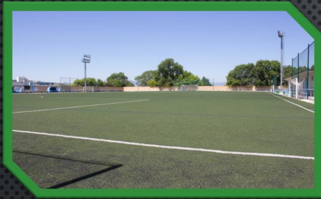
Campo de fútbol